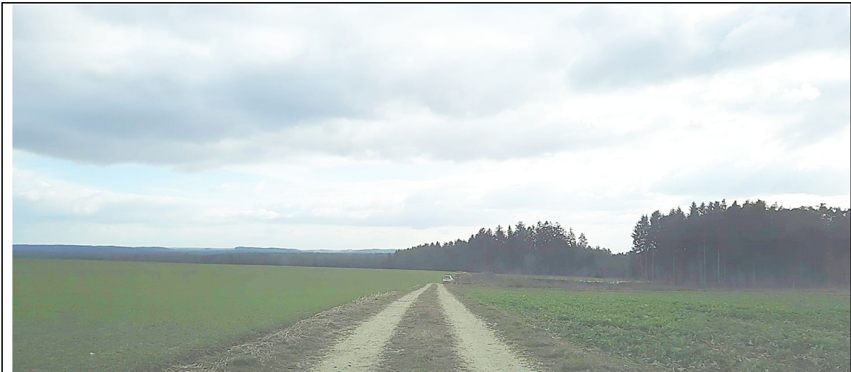
Bild 2: Standort bei Bau-km 0+020 mit südlicher Blickrichtung auf ländlichen Weg und landwirtschaftliche Fläche (links)