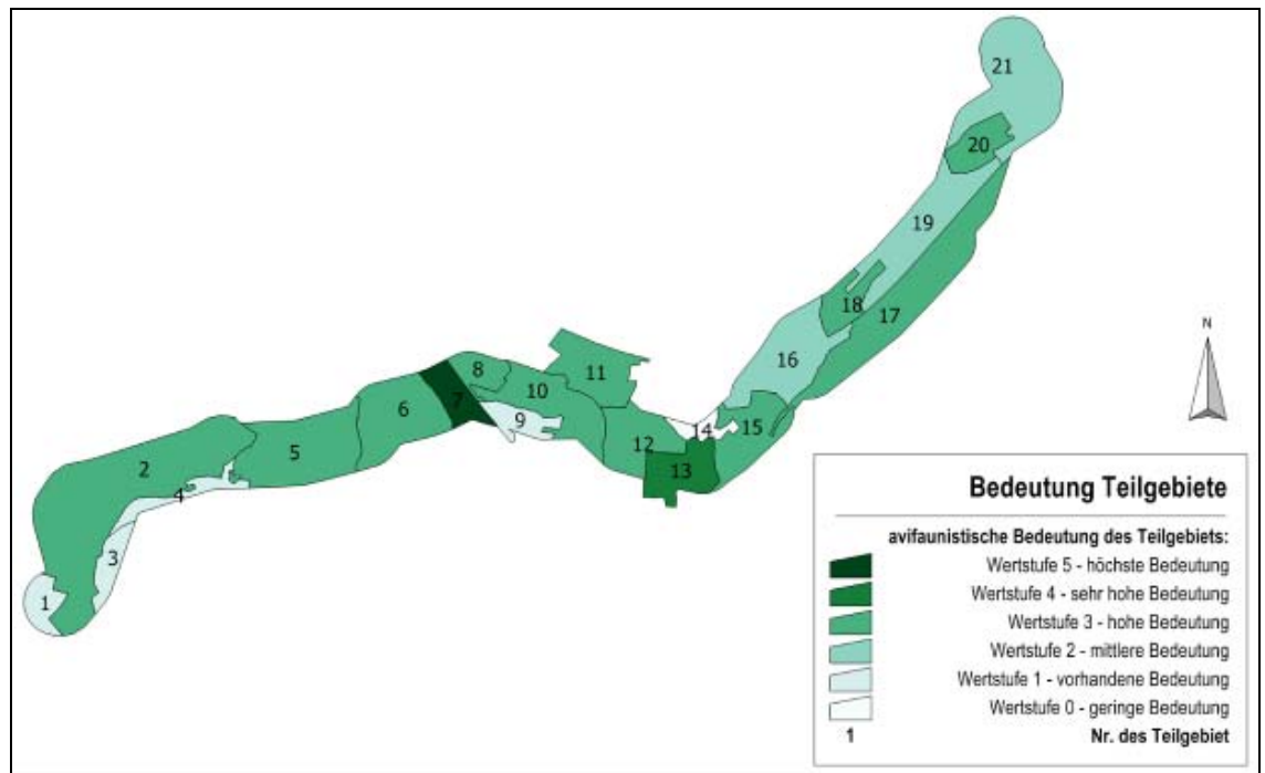
Tabelle 22: Bewertung der avifaunistischen Bedeutung der Teilgebiete Nr. 01-21