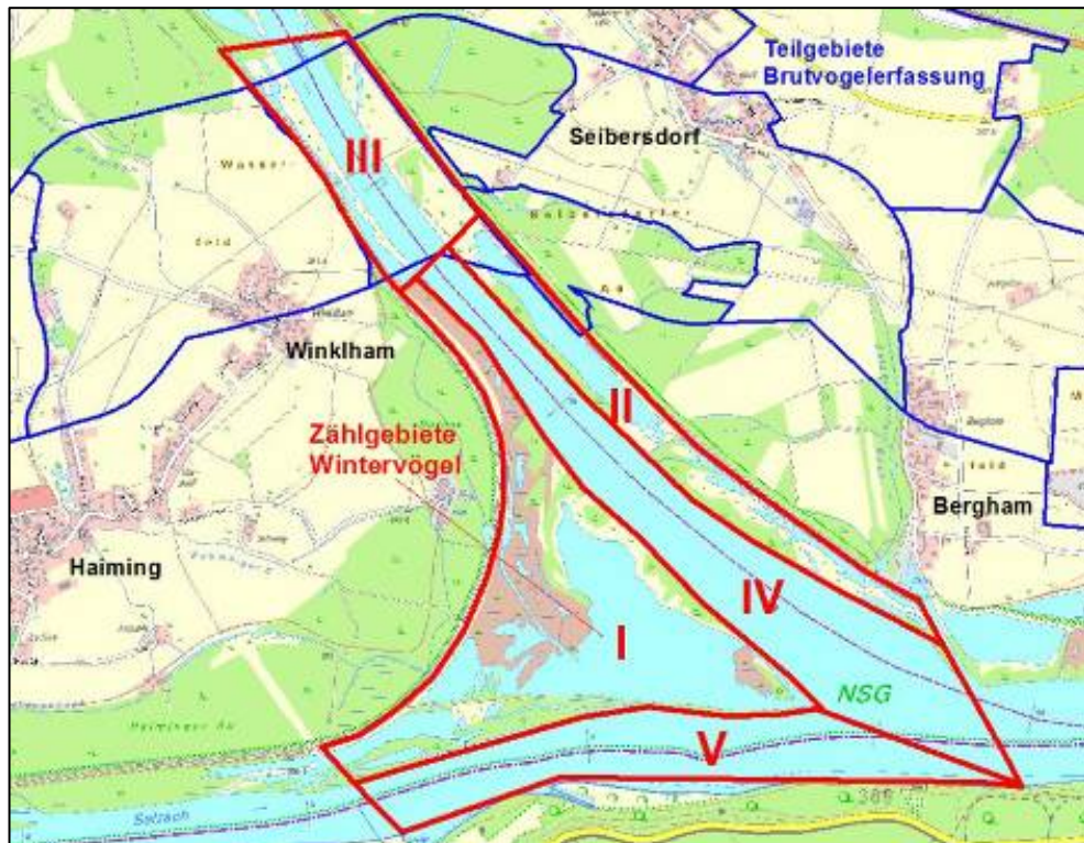
Abbildung 2: Erhebungsgebiete der Wintergastvögel

Die vollständigen Ergebnisse sind dem Fachgutachten von natureconsult (2011), - siehe Anlagenband -, zu entnehmen.