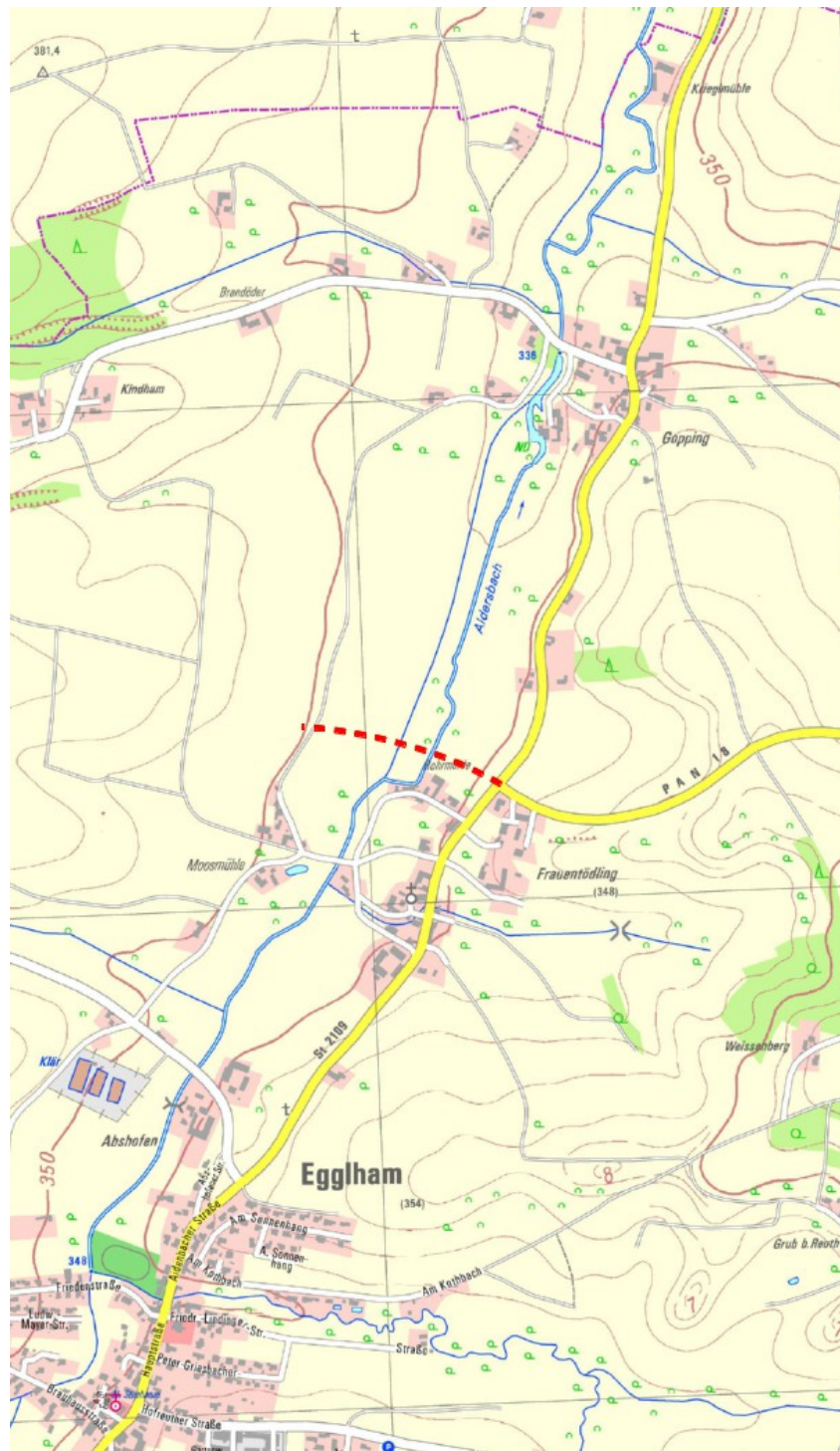
Abbildung 1: Übersicht