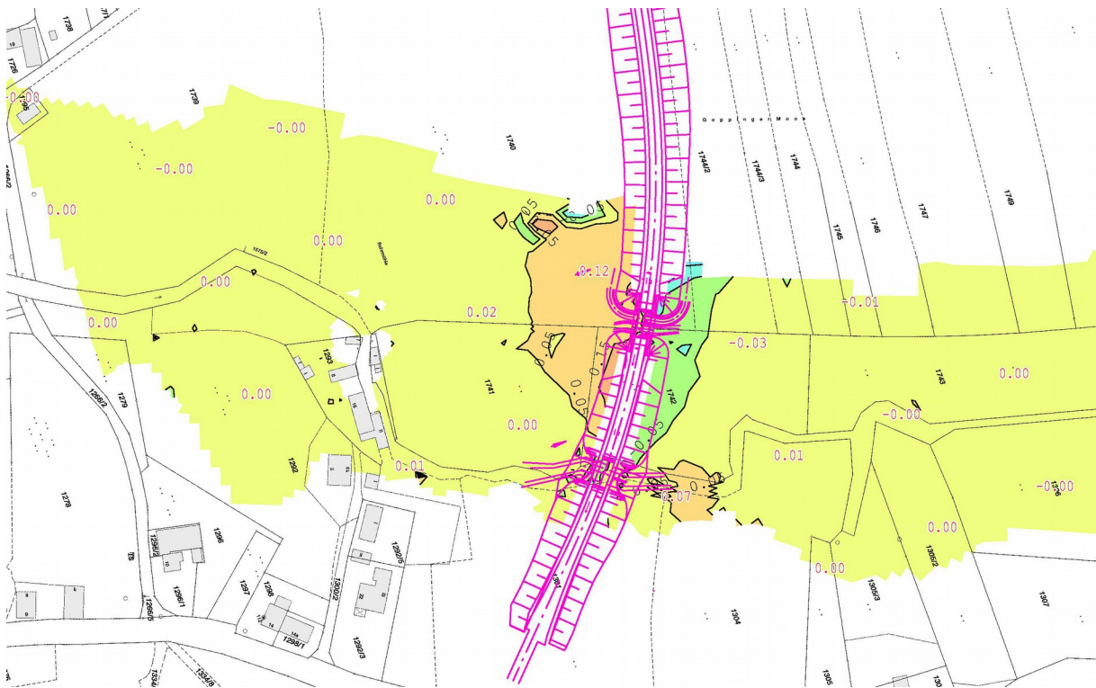
Abbildung 4: Wasserspiegeldifferenz Planung - Bestand HQ 100

Wie die Berechnungsergebnisse zeigen, hat der durch den geplanten Straßendamm verursachte Abflussquerschnittverlust einen lokalen Wasserspiegelanstieg direkt vor dem Damm um bis zu ca. 0,2 m zur Folge (siehe Abbildung 4 und Anlage 4.3). Dieser baut sich nach oberstrom aber sehr rasch wieder ab, so dass auf den restlichen Zweidritteln der Strecke bis zur nächstliegenden Bebauung (Rohrmühle) keine Wasserspiegelerhöhung entsteht. Betroffen ist im wesentlichen die linke Hälfte der Talau.